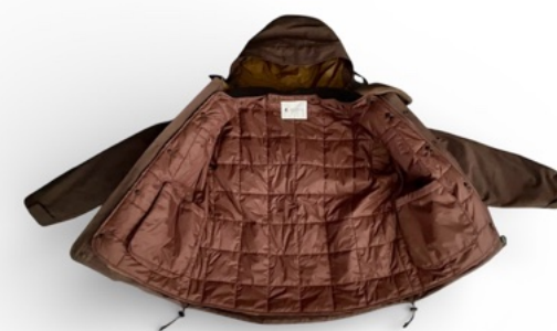
262GM-J1320SHELL M78PARKAとのセット PRICE:¥81,000+TAX

262GM-J1320 DUTCH M78 PARKAと脱着可能な 中綿キルトジャケット 中綿には3M社の“THINSULATE”を使用。 袖が脱着出来るコンバーチブルジャケット。 袖が外れて半袖になります。 半袖にして秋立ち上がりにはインナーにサーマルなどと相性がいいです。